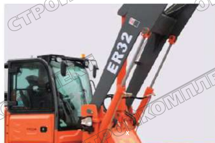
Два более мощных и крупных подъемных цилиндра