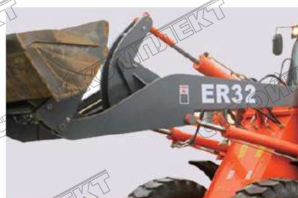
Идеально сбалансированная P-кинематика