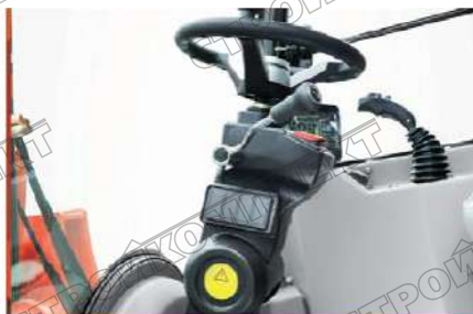
Регулируемая рулевая колонка