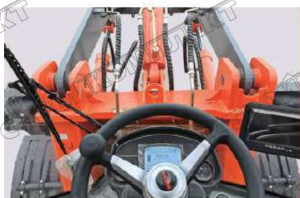
Хороший обзор на 360°