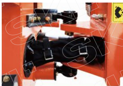
Плавающее шарнирно-качающееся соединение Everun