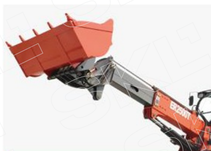
Крепкая телескопическая стрела