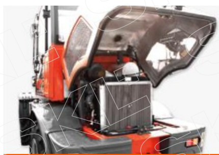
Легко открываемый капот