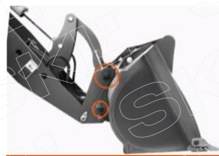
Быстрая и простая смена навесного оборудования