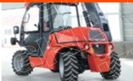
Управление задними колесами, меньший радиус поворота