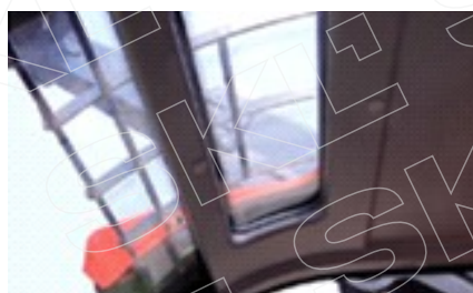
Хороший обзор груза