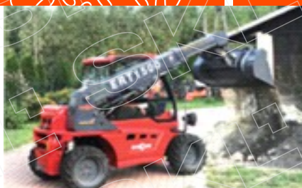
Крепкая телескопическая стрела и большая высота подъема