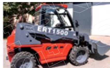
Итальянский дизайн, обновленная обтекаемая форма