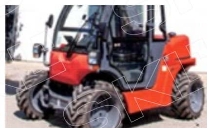
Полный привод, подходит для бездорожья