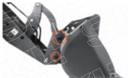
Быстрая и простая смена навесного оборудования