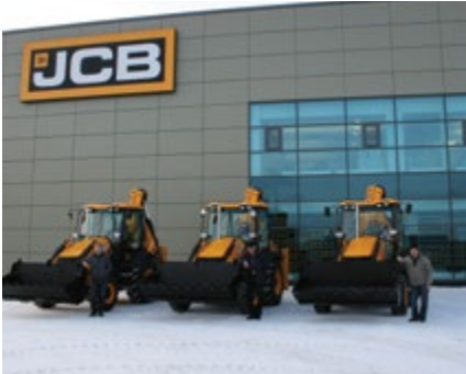
Новая техника на благо города