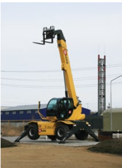
Универсальный телескопический погрузчик MAGNI