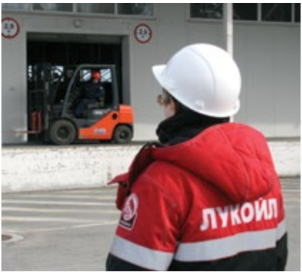
Стройкомплект - это компания, с которой нет проблем