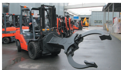
Индивидуальный подход TOYOTA – основа лидерства