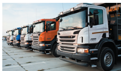
Тест-драйв автомобилей SCANIA – убедитесь в качестве