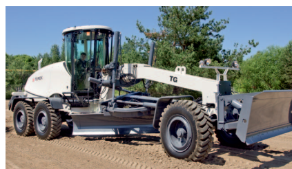
Первая поставка автогрейдеров из новой линейки RM-Terex