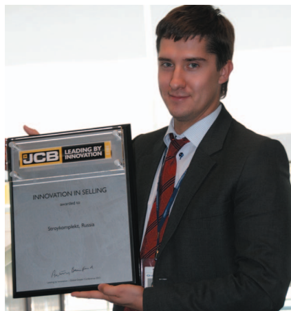
Стройкомплект одержал победу в номинации «Инновации в продажах»